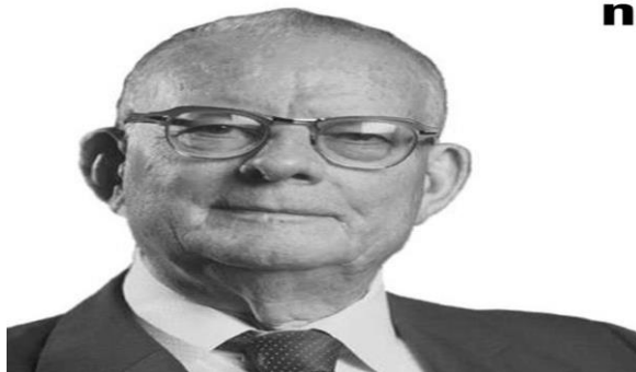
William E. DEMING (1900-1993) Estatístico Pai do Controle de Qualidade Moderno

“Não se gerencia o que não se mede, não se mede o que não se define, não se define o que não se entende, e não há sucesso no que não se gerencia”