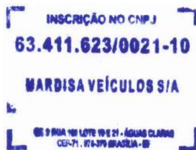
Gilberto Salgado Mardisa Veículos S.A.

Mardisa Veículos S/A.. QS 09 Rua 100 Lotes 19 e 21 Tel: (61) 3120-3000/(61)3120-3003 Fax: (61) 3120-3001 CEP 71.976-370 Águas Claras/DF. www.mardisa.com.br