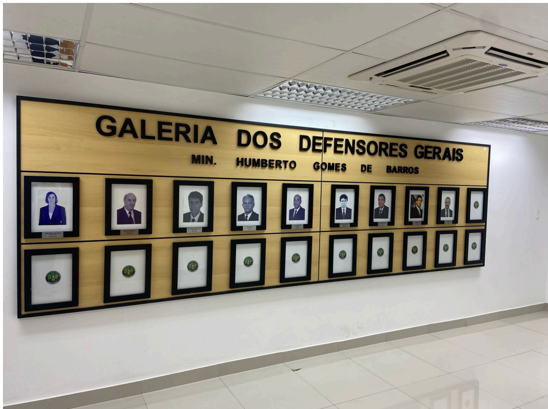
Imagem atual da Galeria dos Defensores-Gerais (modelo para ser produzida a nova galeria)